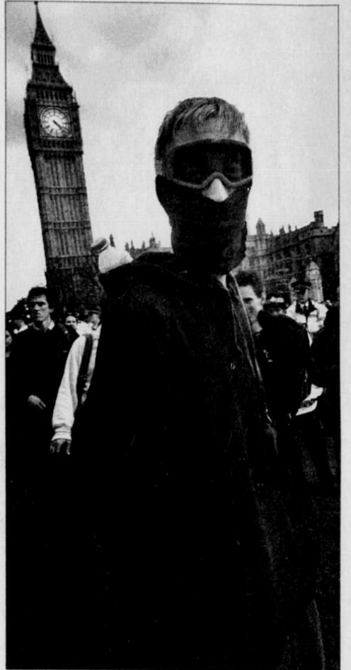
FORSIKTIG: Eksempel på brite som har tatt sine forholdsregler.

Britene svindles for 10 milliarder kroner i året. Nå vil myndighetene lære dem å bli mindre godtroende.